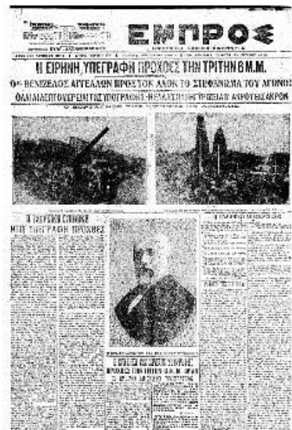
Ο αστικός Τύπος πανηγυρίζει (ΕΜΠΡΟΣ, 30-7-1920)