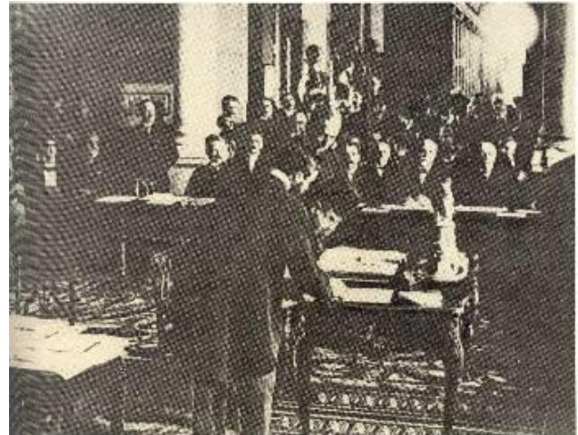
Ο εκπρόσωπος της Τουρκίας υπογράφει τη Συνθήκη των Σεβρών

Τ ι σήμαινε για τους λαούς το σύστημα των Βερσαλιών; Ο Λένιν δίνει την πραγματική διάσταση των πραγμάτων 8 . Η ειρήνη των Βερσαλιών, υπογράμμιζε, «είναι μια πρωτάκουστη και ληστρική ειρήνη, που θέτει σε κατάσταση σκλάβων δεκάδες εκατομμύρια ανθρώπους και μέσα σ' αυτούς και τους πιο πολιτισμένους... Προέκυψε μια τέτοια κατάσταση, που τα 7/10 του πληθυσμού της Γης βρίσκονται σε κατάσταση δουλείας... Να για ποιο λόγο όλο αυτό το διεθνές καθεστώς, η τάξη πραγμάτων που στηρίζεται στη συνθήκη των Βερσαλιών, βρίσκεται πάνω σε ηφαίστειο, γιατί τα 7/10 του πληθυσμού όλης της Γης που υποδουλώθηκαν περιμένουν ανυπόμονα να βρεθεί κάποιος που θα αρχίσει τον αγώνα για να αρχίσουν να τσαντάζονται όλα αυτά τα κράτη».