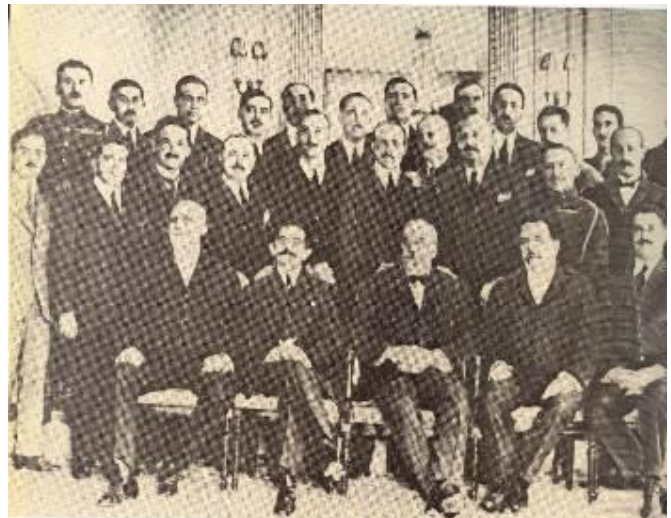
Η ελληνική αντιπροσωπεία στο Συνέδριο των Παρισίων

Ας δούμε όμως ειδικότερα το ζήτημα της Τουρκίας, όπως αυτό τέθηκε και εξετάστηκε στο Συνέδριο των Παρισίων, ένα ζήτημα στο οποίο είχε άμεση εμπλοκή η Ελλάδα.