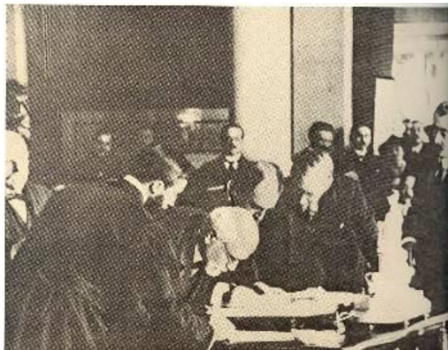
Ο Ελευθέριος Βενιζέλος υπογράφει εκ μέρους της Ελλάδας τη Συνθήκη των Σεβρών

Είμαι ευτυχής αναγγέλλων προς υμάς ότι σήμερον εβδόμην επέτειον της υπογραφής της Συνθήκης του Βουκουρεστίου, υπεγράφησαν η Συνθήκη ειρήνης μετά της Τουρκίας, η Συνθήκη δι' ης αι κυριώταται Σύμμαχοι Δυνάμεις μεταβιβάζουσιν εις την Ελλάδα την κυριαρχίαν επί της Δυτικής Θράκης ήτις είχε παραχωρηθεί προς αυτάς υπό της Βουλγαρίας διά της Συνθήκης του Νεϊγύ και η Συνθήκη μετά της Ιταλίας δι' ης αύτη μεταβιβάζει προς ημάς τα Δωδεκάνησα.